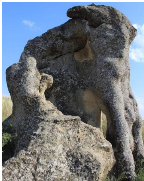
Каменные слоны (Каменные столбы)